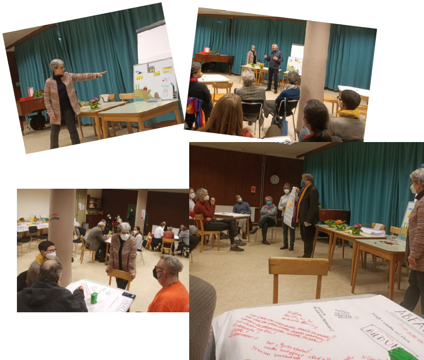
Schöpfungsfest am 12. Juni.

Am 24. Mai findet der letzte Workshop dieser Art zum Thema Möbel statt. Diesmal wird er von der evangelischen Jugend gemeinsam mit den Fridays4Future mitgetragen. Diese vier Workshops waren Auftakt zu unserem großen Schöpfungsfest