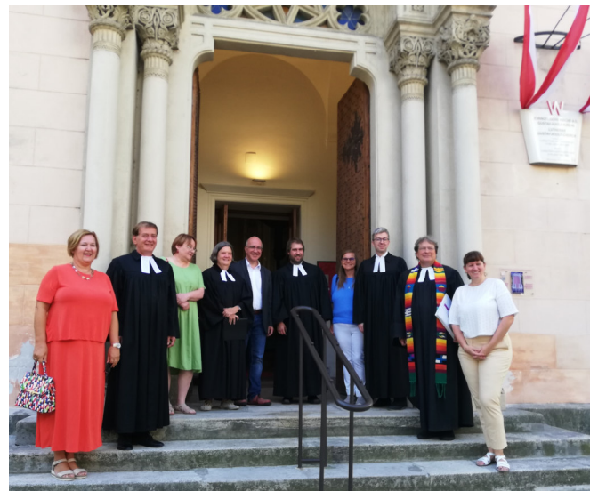
Erster gemeinsamer Gottesdienst in der Region „Mitte“ am 10. September 2023 .

Gestaltet von allen vier Pfarrgemeinden: Innere Stadt, Gumpendorf, Neubau/Fünfhaus und Alsergrund